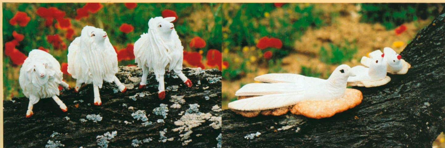
Tipici soggetti siciliani in ghiaccia reale.