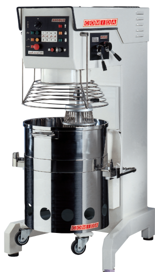
SELENE mescolatrici planetarie