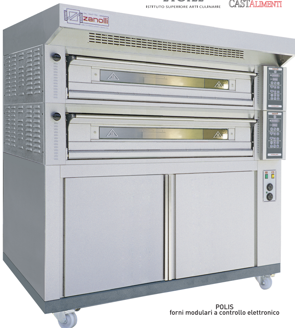
POLIS forni modulari a controllo elettronico