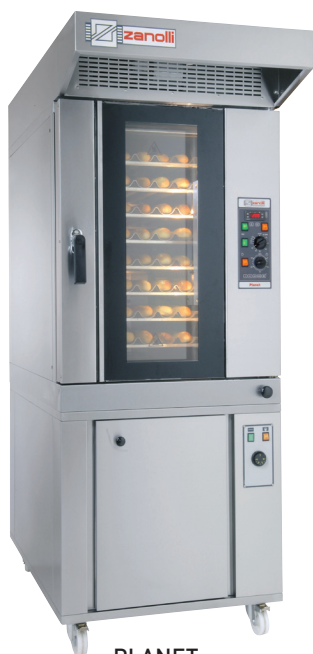
PLANET forni a convezione