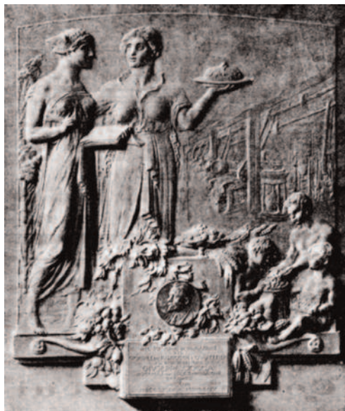
Targa in bronzo (70x60 cm), opera dello scultore Enrico Saroldi, rappresentante l'arte che addita la via all'industria dolciaria, e la medaglia d'oro con l'effigie di Giuseppe Ciocca.

no sempre dei perfezionamenti da applicare ai metodi già noti: ecco l'idea nostra, ecco lo scopo dei nostri concorsi”.