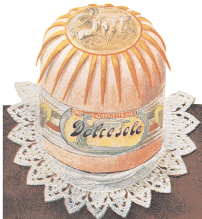
Il Dolcesole, la specialità “nazionale” lanciata dal “Giornale” del Ciocca nel 1938. A questo dolce abbiamo dedicato un articolo sul n. 142.

Nel primo trimestre del 1928 vengono dichiarati in Italia 3.339 fallimenti (una media di 1.113 al mese in confronto ai 944 del 1927, 715 nel 1926 e 590 nel triennio 1912-14). Principalmente si tratta di dissesti del commercio, seguiti dall'industria. I piccoli laboratori artigianali non riescono a sopravvivere alle difficoltà finanziarie, le banche sono disposte a finanziare solo grandi gruppi, e così le piccole realtà artigiane vengono assorbite da quelle più grandi. A Torino nasce la Unica, Unione Nazionale Industria Cioccolato e Affini, che incorpora marchi apprezzati che resteranno sul mercato per molti anni, come Talmone, Bonatti, Moriondo Gariglio, Galettine Biscuits, ecc.